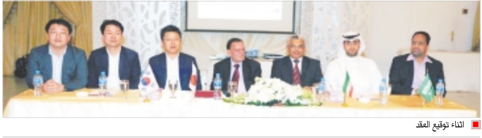
إثناء توقيع العقد

وأوضح الكازمي أن شركة الخليج أمدي شركات مجموعة الكازمي الدولية لها من خبرة في هذا المجال تمتد إلى أكثر من 45 عاماً وهي حاصلة على شهادات الأيزو وشهادة HSC الدولية لآعمال النقل والخدمات اللوجستية وقد شاركت في أكثر من 16 مشروعاً في مجال البترول والطاقة على مدى الخمسة عشر عاماً الأخيرة وبالتعاون مع شركة المجدوعي السعودية والحاصلة على تسجيل موسوعة جينيس الدولية كأكبر شركة نقل للأعمال الثقيلة والأبعاد فوق القياسية لافتاً إلى أن الشركة ستقوم بتوفير كل الأعمال المتعلقة بالاستلام والتخليص الجمركي ونقل كل الأجهزة والمعدات ولوازم البناء الخاصة للمشروع من الميناء وحتى موقع المشروع بكفاءة تامة.