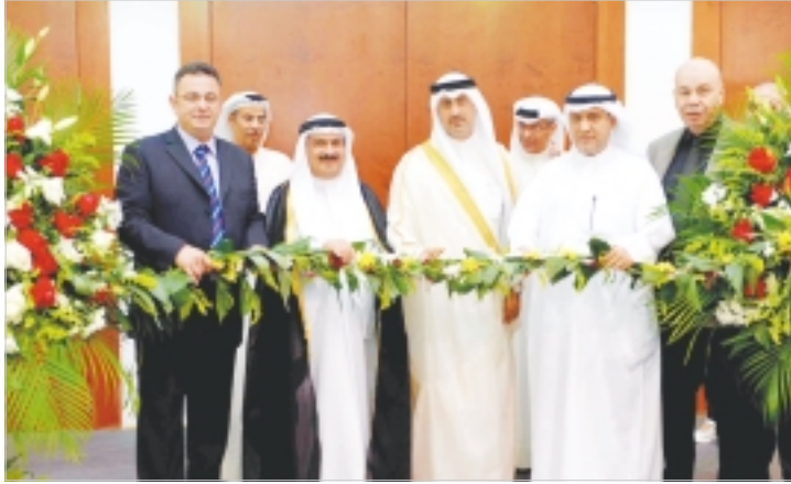
الشيخ نمر الصباح والشيخ مالك الصباح يفتتحان المعرض