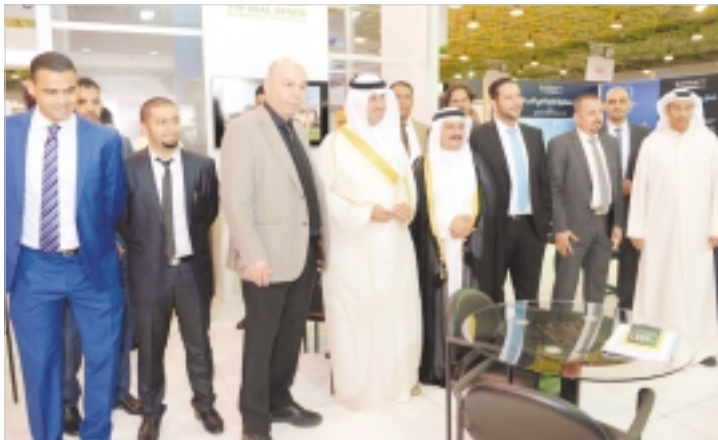
جولة داخل معرض العقار والاستثمار

مساحات بلغت أكثر من 3400 متر مربع داخل قاعة المعرض، لتدل دلالة واضحة على مدى الاهتمام الذي تجديبه هذه الشركات بمعرض العقار والاستثمار بشكل خاص، وبالسوق الكويتي بشكل عام.