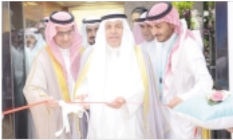
أثناء افتتاح المكتب الاقليمي بحضور السفير السعودي د.عبدالعزیز الفايز

ولفت إلى أن الشركة تشغل من وإلى الكويت حالياً نحو 38 رحلة أسبوعياً في الاتجاهين، إلى أربع محطات في السعودية، بعد أن كانت رطلتين فقط منذ ست سنوات إلى الرياض، متوقفاً الإعلان عن التشغيل إلى المحطة الخامسة الجديدة قريباً، إذ أن الهدف الرئيسي من التشغيل إلى الكويت زيادة حجم الحركة بما يتوافق مع حجم العلاقات بين البلدين، خصوصاً أن سوق الكويت من الأسواق المهمة